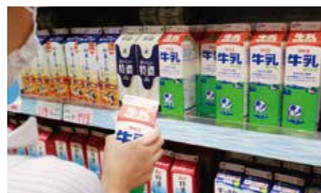
すぐ食べるときは手前の商品から買いましょう